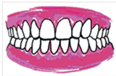
Ligne médiane déviée