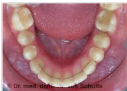
Fil de contention sur la mâchoire du bas

Bagues Speed : Durée de traitement réduite jusqu'à 50 % grâce à une meilleure transmission de la tension, peu d'irritation des lèvres et de la langue du fait d'une conception peu encombrante, esthétique améliorée et hygiène simplifiée.