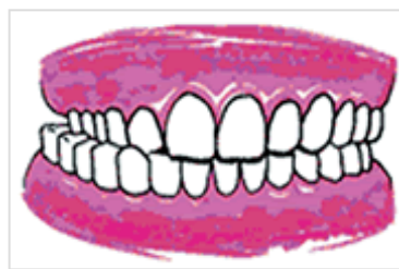
Occlusion croisée postérieure