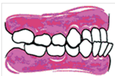
Prognathisme vu de profil