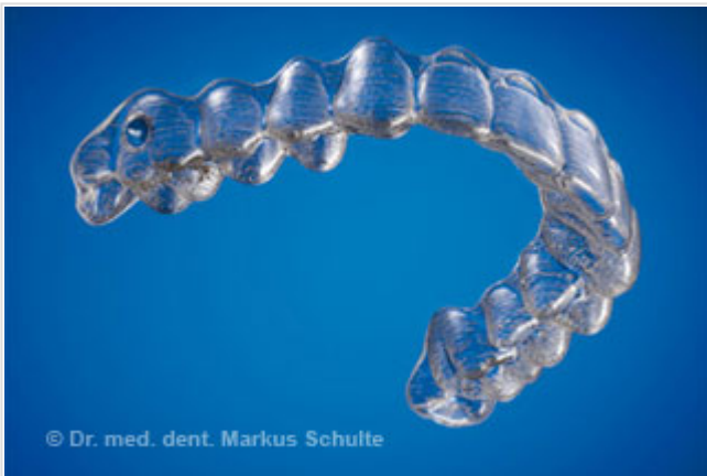
Aligner transparent Invisalign Teen

Invisalign Teen est une méthode innovante de traitement des malpositions dentaires chez l'adolescent. Contrairement aux « grillages » traditionnels, le traitement repose sur des gouttières transparentes amovibles (également appelées aligners) étroitement plaquées sur les dents. Même à distance de conversation normale, ces appareils de haute technologie sont pratiquement invisibles. Ces gouttières fines très élastiques sont numérotées : chacune est portée pendant deux semaines avant d'être remplacée par la suivante, comme des lentilles de contact pour les dents. Toutefois, toutes les malpositions dentaires ne peuvent forcément être traitées par Invisalign. Nos orthodontistes ont reçu une formation spéciale qui leur a valu une certification pour l'utilisation d'Invisalign. Ils ont reçu la mention « Praticien en or » par Align Technology et connaissent parfaitement, en tant qu'utilisateurs expérimentés, les possibilités et les limites de cette méthode de traitement fascinante.