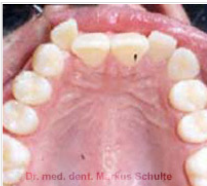
Avant le traitement