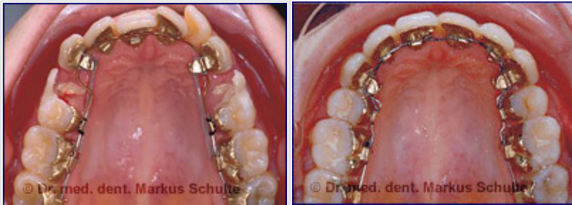
Attaches linguales Incognito sur la mâchoire supérieure, avant et après traitement