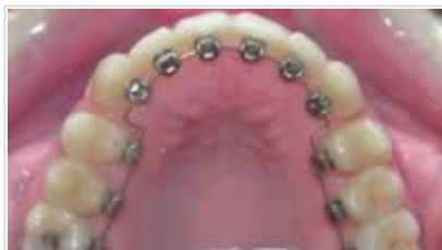
Technique linguale : Vue de l'intérieur...

La technique linguale constitue une nouveauté absolument révolutionnaire. Les bagues et les fils ne sont pas placés sur la face extérieure, mais de façon linguale, c'est-à-dire sur la face intérieure des dents, et donc totalement invisibles pour un observateur extérieur. Ces appareils camouflés fonctionnent tout aussi bien que les appareils traditionnels.