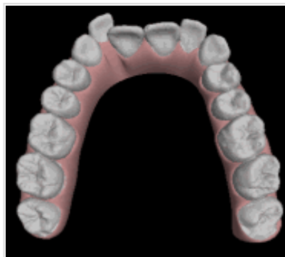
Simulation du déplacement des dents