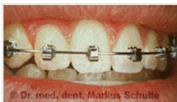
Petites mais efficaces : les bagues Speed raccourcissent la durée du traitement, tout en irritant moins les lèvres et la langue et en simplifiant l'hygiène buccale

Les nouvelles bagues Speed sont bien plus petites que les bagues traditionnelles utilisées jusque-là. Grâce à une meilleure transmission de la tension, il est possible d'obtenir une durée de traitement pouvant être diminuée de 50 % par rapport aux bagues normales.