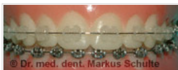
Bagues en céramique sur la mâchoire supérieure, bagues traditionnelles en acier sur la mâchoire inférieure

Jusqu'à il y a quelques années, ces appareils d'orthopédie dentofaciale avaient un aspect extrêmement repoussant (« sourire d'enfer »). Actuellement, il existe des bagues en céramique transparentes ou de la couleur des dents, qui confèrent presque à l'appareil l'aspect esthétique de bijoux dentaires.