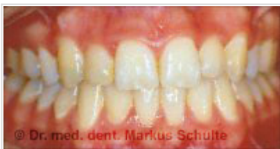
Après le traitement

Comparaison : à gauche, des bagues linguales normales ; à droite, des bagues linguales Incognito ultraplates