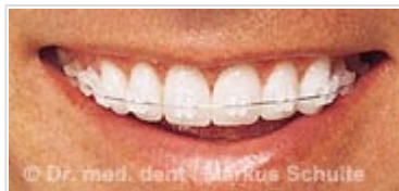
Bagues en céramique

d'enfer » dû à l'appareil dentaire, qui s'est développé esthétiquement ces dernières années, ne plait pas forcément à tout le monde :