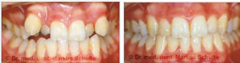
Patiente de 37 ans avant et après orthodontie avec appareillage lingual invisible

Avoir des dents droites et régulières constitue un atout pour la vie. Pourtant, la Nature n'est souvent pas tendre avec nous : plus de 50 % des enfants souffrent de malposition dentaire (dysgnathie) nécessitant un traitement d'orthopédie dentofaciale (orthodontie) avec appareil dentaire. Par le passé, ce type de correction dentaire était souvent omis, ou non pratiqué dans les règles de l'art, ce qui explique pourquoi, aujourd'hui, nombreux sont les adultes qui souffrent aussi de malpositions dentaires. Ce mauvais alignement des dents (dysgnathie) n'a pas seulement des conséquences esthétiques, il peut parfois être à l'origine de graves problèmes fonctionnels .