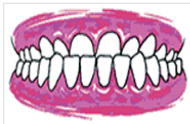
Occlusion inversée antérieure (prognathisme)