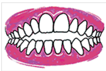
Béance occlusale antérieure