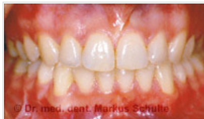
Patiente de 29 ans avant et après traitement par Invisalign