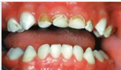
Caries des dents de lait

Les dents de lait jouent un rôle important de conservation des espaces , c'est-à-dire qu'elles gardent les places correctes requises par les prochaines dents définitives. La perte prématurée des dents de lait postérieures pour cause de caries peut être à l'origine de malpositions graves de la denture définitive. L'hygiène dentaire doit donc être parfaite dès le plus jeune âge, et l'alimentation saine, pour conserver les dents de lait jusqu'à la percée des dents définitives.