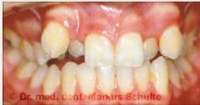
Avant le traitement

en règle générale, le patient ne sent plus l'appareil lingual Incognito au bout de 2 à 3 semaines seulement, tandis que les irritations du début du traitement sont nettement diminuées.