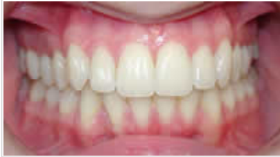
... et de l'extérieur

éléments de maintien personnels, adaptés à la forme de dent du patient, plaqués à plat contre les dents et faisant une saillie moins importante dans la bouche par rapport aux bagues linguales habituelles. La phase d'adaptation est ainsi sensiblement réduite :