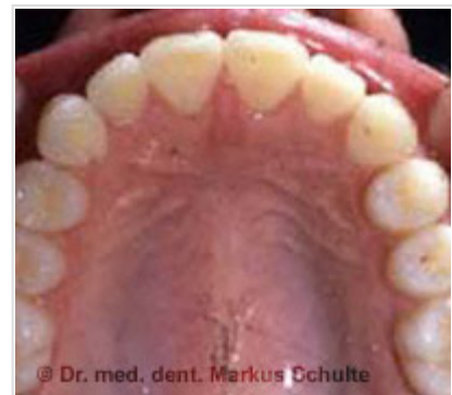
Après le traitement