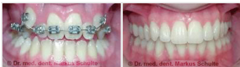
Avant et après traitement par appareil multibague sur la mâchoire supérieure et la mâchoire inférieure

Le traitement orthodontique à l'aide d'appareils dentaires fixes dure généralement de 2 à 3 ans, soit bien moins longtemps en moyenne qu'avec un appareil dentaire amovible. En outre, l'appareil « travaille » en continu dans la bouche, indépendamment de la discipline de l'enfant et des parents. L'action des appareils dentaires fixes n'est par ailleurs pas liée à l'âge : ils fonctionnent aussi bien chez les adultes que chez les adolescents.