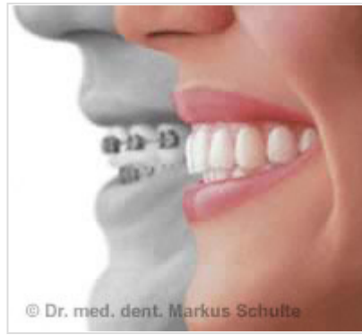
Comparaison avec un appareil multibague fixe

Depuis longtemps, les orthodontistes et les patients souhaitent pouvoir obtenir un traitement orthodontique invisible et sans appareil fixe. Grâce à une technologie dernier cri, ce rêve est devenu réalité : ce nouveau traitement s'appelle Invisalign (contraction des mots Invisible et Alignement). Une série de films élastiques, fins, presque invisibles, appelés aligners , est modelée au laser à partir d'un composite élastique très résistant, et permet de déplacer en douceur les dents jusqu'à leur position souhaitée. La technologie d'imagerie 3D ultramoderne associée à des analyses en trois dimensions permettent cette révolution dans le domaine de l'orthopédie dentofaciale : en collaboration avec des universités américaines renommées, les spécialistes en logiciels de la société américaine Align Technologies ont développé un programme de planification et de diagnostic en trois dimensions.